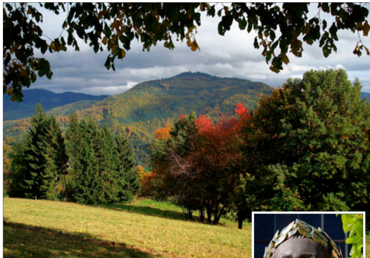
Vom Rümmelesbühl, Idealberg Johann Peter Hebels (Bild rechts zeigt das Denkmal in Hausen), blickt man auf die Hohe Möhr.

nach Süden den Dinkelberg. Auf dem breiter werdenden Weg kommen wir zum Wegweiser „Gresgener Ebene“. Dort biegen wir links abwärts in Richtung Knobel und Hausen im Wiesental (blaue Raute) ab. Zunächst laufen wir auf einem Teersträßchen, halten uns an der ersten Weggabel rechts und gelangen an der zweiten Weggabelung auf den ungeteerten alten Gresgener Weg.